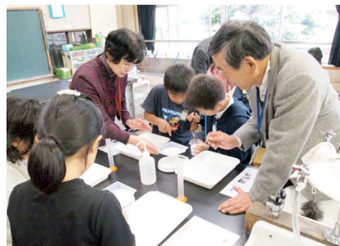
ディレクトフォースによる授業風景

今年度、麴町小学校ではエコキッズ探検隊の授業を全学年で実施しており、同校の副校長先生に取り組みや感想を聞いたインタビュー記事が、当協会のウェブサイトで近日公開予定です。