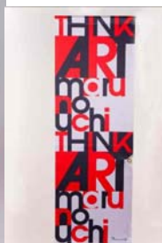
エリア内のイベント で使用したフラッグを リメイク