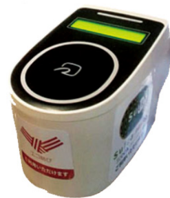
加盟店に設置される端末

「エコ結び」は日常の消費行動を通して、無理なく環境配慮型行動をとれる仕組みとなっています。オフィシャルWEBサイト( https://www.ecomusubi.com/ )にてPC・携帯電話からの登録により「エコ結び」の会員となった消費者の方には、本システムに賛同する大丸有エリア内の加盟店舗でSuica及びPASMOでの代金支払い、もしくはエリア内で開催される「丸の内朝大学」をはじめとする環境イベントに参加いただくことで「エコ結びポイント」を貯めていただけます。貯まった「エコ結びポイント」の使い道は「企業のもったいない3R型商品との交換」もしくは「大丸有エリア内外への持続可能な環境共生型まちづくりへの投資」の2つからご選択いただけます。また、同時に加盟店舗では「エコ結び」会員が決済した代金の1%相当を「エコ結び基金」に積み立て、大丸有エリア内外の持続可能な環境共生型まちづくりへ投資します。