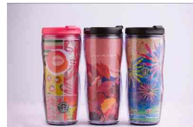
スターバックス デッドストックのタンブラー

※交換、抽選に要するポイント数はエコ結びオフィシャルWEBサイトにて後日発表いたします。