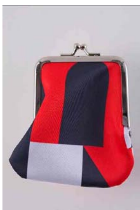
PASS THE BATON リメイク小物