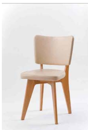
三菱地所 モデルルームで使用した椅子