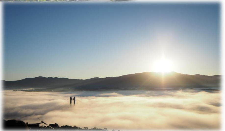
秩父市街にかかる雲海