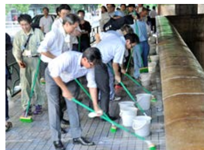
「鎌倉橋橋洗い」の様子