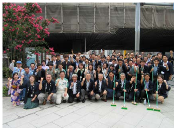
「鎌倉橋橋洗い」昨年の様子