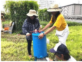
⑤ 遠心分離機を回転させる