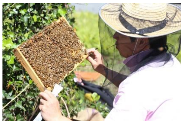
① 巣箱から巣枠を取り出す作業