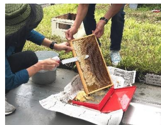
③ 巣枠の「蜜ブタ」を切り落とす作業