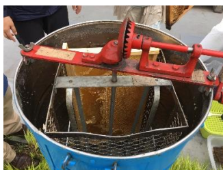
④ 遠心分離機内に巣枠をセット